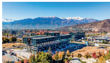
Núcleo Los Trapenses